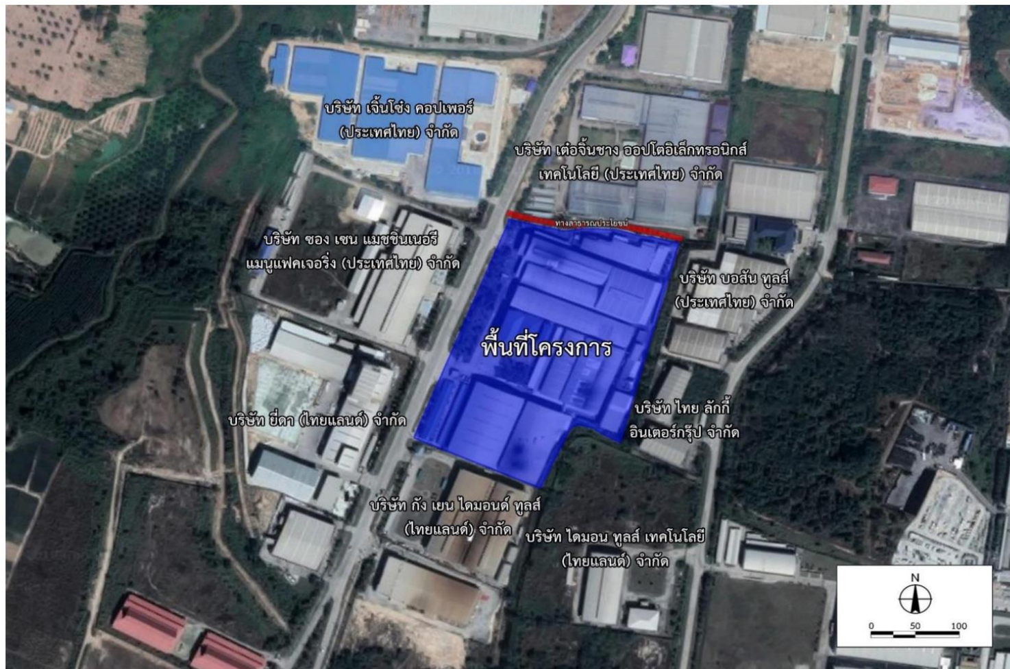
รูปที่ 1.3-1 ที่ตั้งโครงการและพื้นที่โดยรอบ